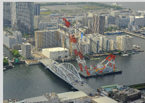
建設時の築地大橋