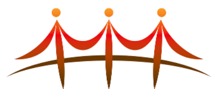
東京・横浜・大阪の橋 パネル展