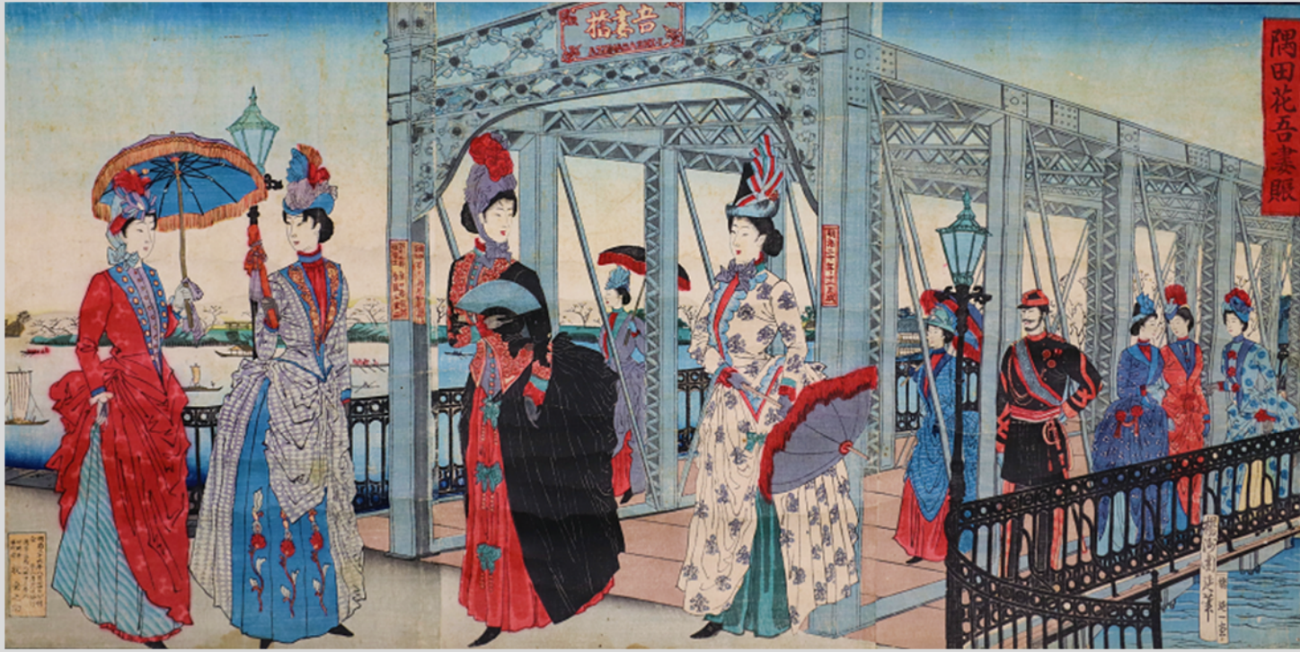
隅田花吾妻賑 楊洲周延 1893年 (吾妻橋)