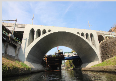
聖橋 (土木と建築の融合)