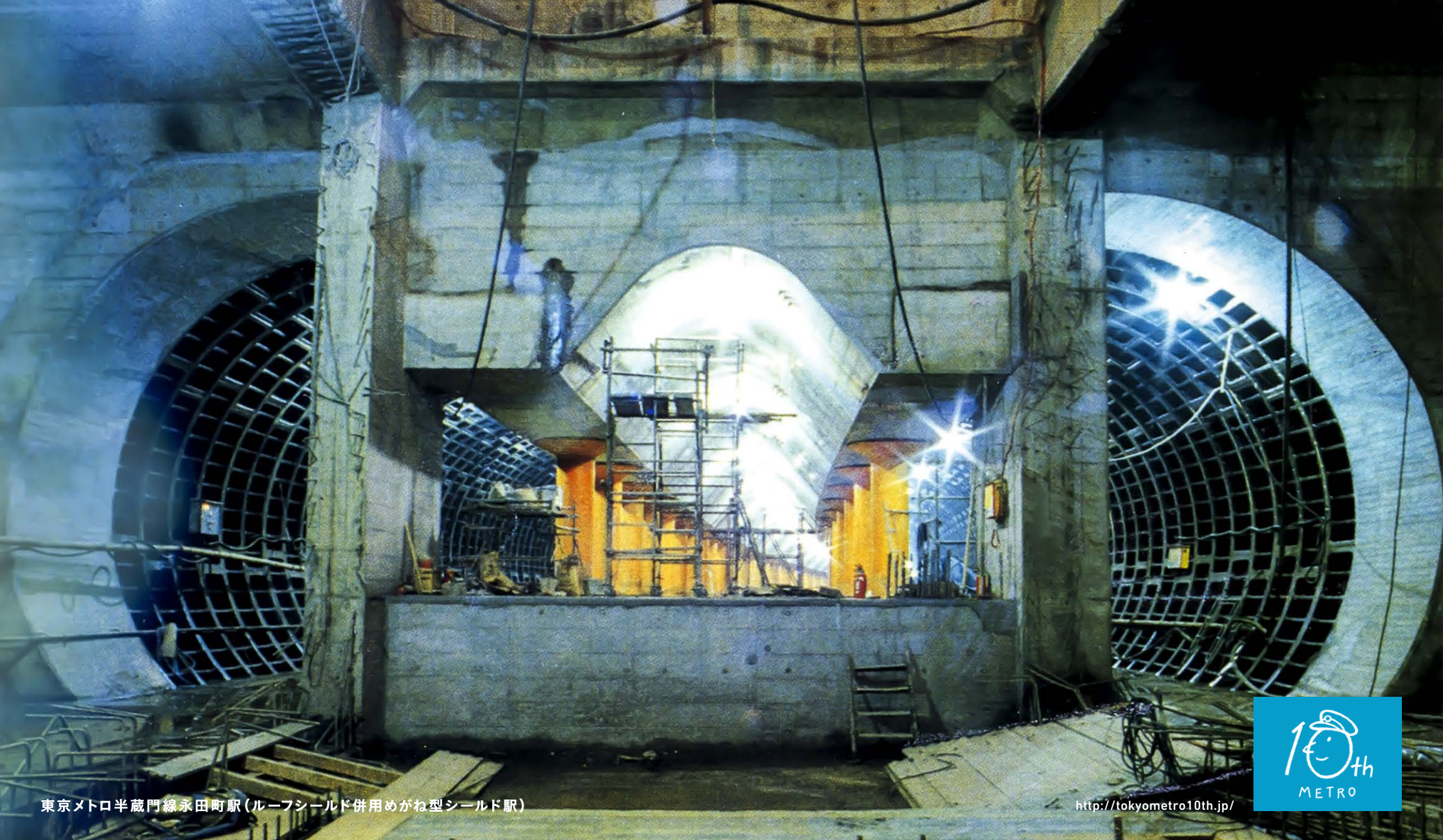
東京メトロ半蔵門線永田町駅(ルーフシールド併用めがね型シールド駅)